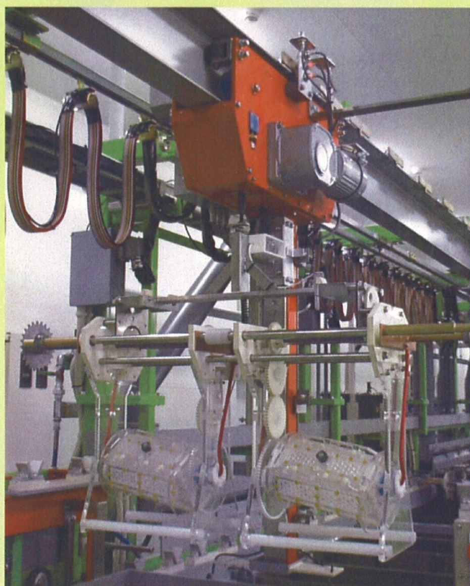
自動機仕様2連型バレル (BFバタフライ型アミ張りタイプ)